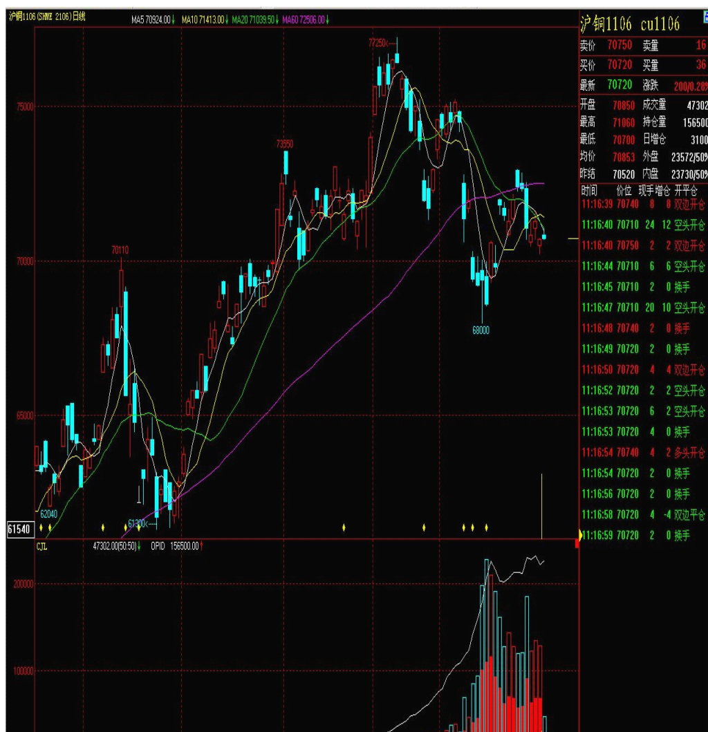
表六：沪铜1106合约行情走势图