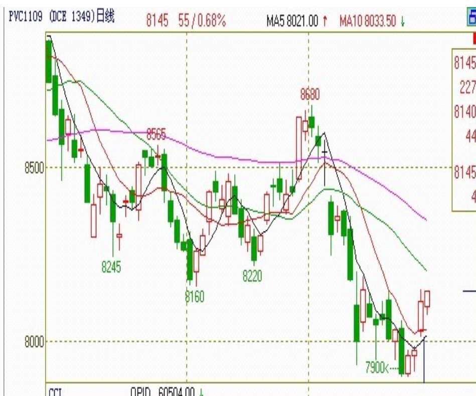
表五：pvc1109 合约行情走势图

通过以上分析可以看出，行情虽然出现反弹，但还没达到反转的要求，期价或将在此价位上震荡一段时间，上行中，密切关注期价是否能在日线上冲破 20 均线的束缚。期价能站稳 20 日均线，后期反转可望。