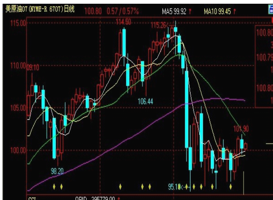
表一：美原油走势图

受美国不利经济数据影响，26 日纽约市场油价在连续两天上涨后下滑，但仍收于每桶 100 美元上方。