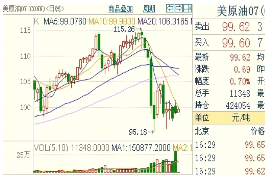
表三：布伦特原油期货一周走势