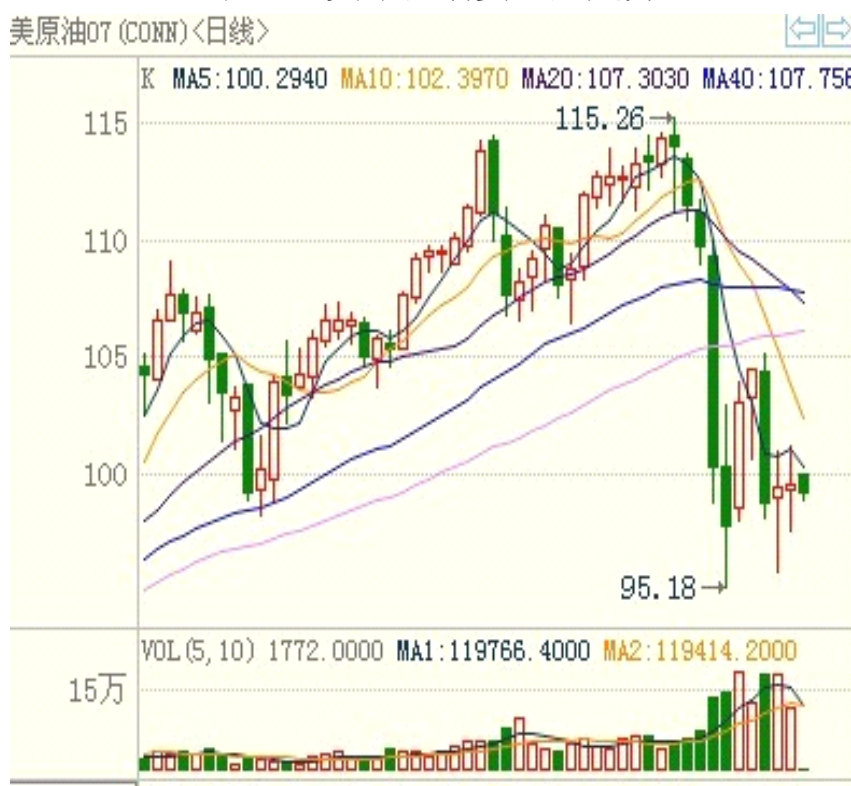
表三：美原油期货一周走势