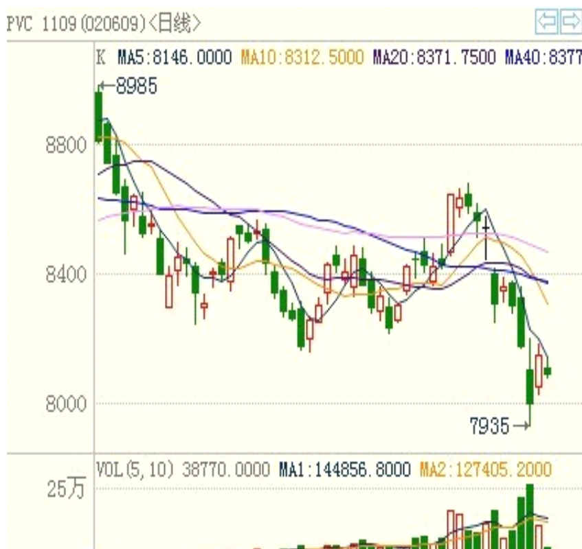
表六：pvc1109合约行情走势图

图形上分析，均线形态向下发散，行情沿 5 日均线下跌形态良好，短期内未有扭转的迹象；周线上分析，价格处于箱体下沿，8000 整数关口并未得到有效突破，均线形态进一步交织粘合，假若不能得到有效突破，受到原材料成本价格的支撑，后期 pvc 期价或将维持高位震荡，但短期内，PVC 市场整体走势偏弱，继续回落的可能性较大。