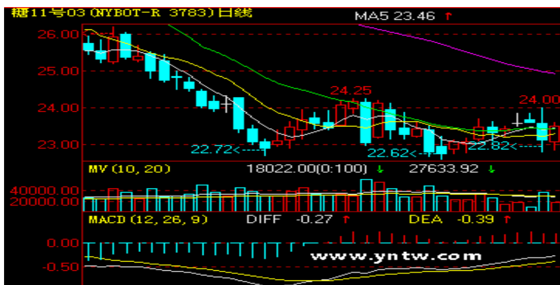
主力 3 月合约日线图

2. 郑糖：12 月 30 日郑糖主力 1209 合约全天报收 5930 元/吨，结算价 5967 元/吨，盘中一度创下 5899 元/吨的年内最低点，较月初的 6399 元/吨，下跌了 400 元/吨，下跌幅度达到了 8.47%。