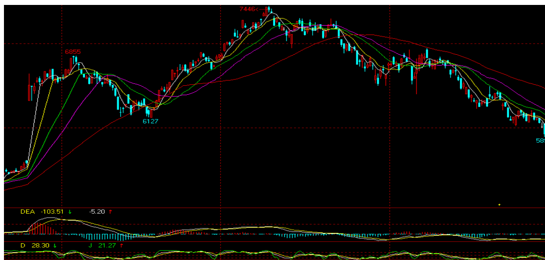
主力 1209 合约日线图

2. 郑糖：12 月 30 日郑糖主力 1209 合约全天报收 5930 元/吨，结算价 5967 元/吨，盘中一度创下 5899 元/吨的年内最低点，较月初的 6399 元/吨，下跌了 400 元/吨，下跌幅度达到了 8.47%。