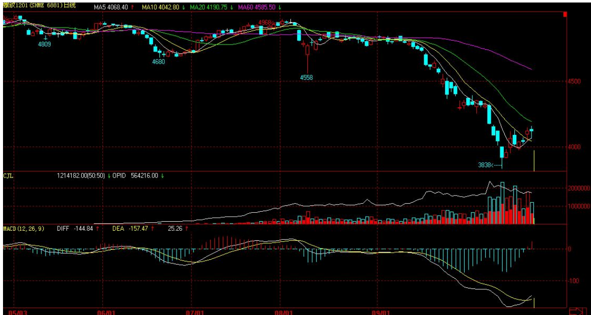
截至 2011 年 9 月 30 日收盘的上海螺纹钢 1201 合约日线

螺纹钢在本月月初，在上个月低点附近徘徊，随后，价格快速下行，并且得到了量仓数据支持，并且在 10 月 20 日到达了近两年的新低----3838 这一点位。