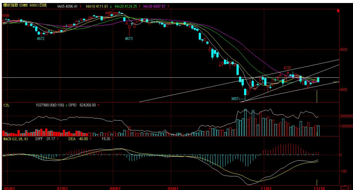
截止 2011 年 11 月 30 日收盘的上海螺纹钢指数合约日线

由于 1205 合约专为主力合约时间不长，在技术分析上为了更长期的观察螺纹钢的走势，引用文华财经螺纹钢指数作为分析参考依据。