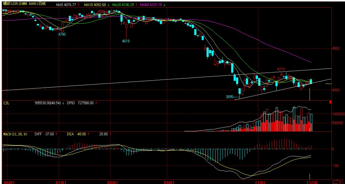
截至 2011 年 11 月 30 日收盘的上海螺纹钢 1205 合约日线