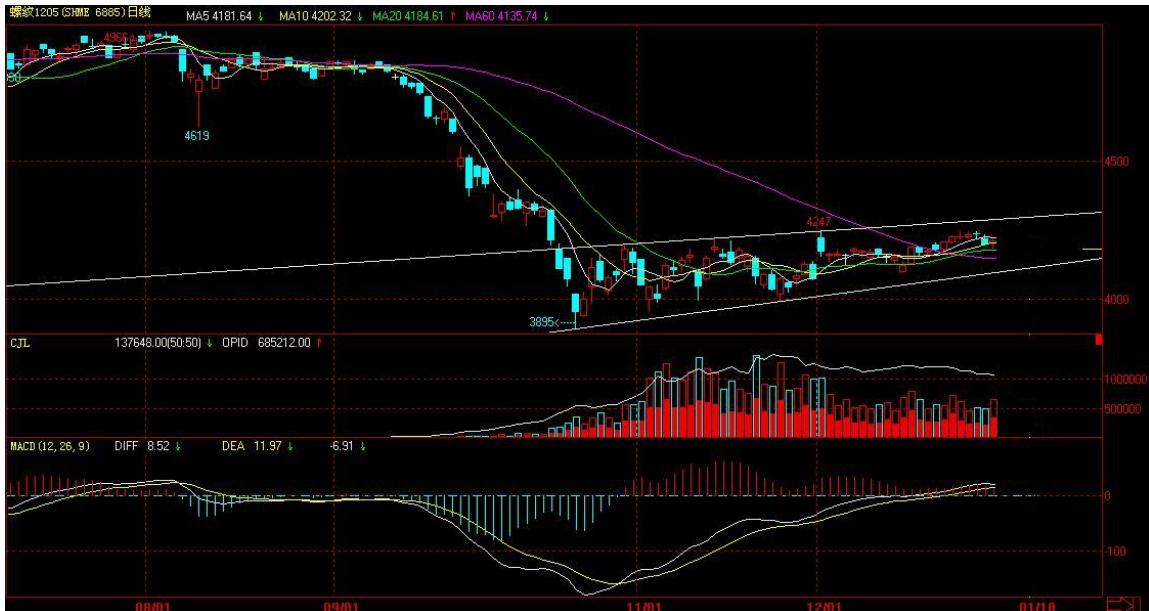
截至 2011 年 12 月 30 日收盘的上海螺纹钢 1205 合约日线

螺纹钢 1205 合约自 9 月份开始快速下行，在 10 月底来到近几年的新低后，下跌趋势出现问题。随后在一个略略向上倾斜的区间内向上盘整。